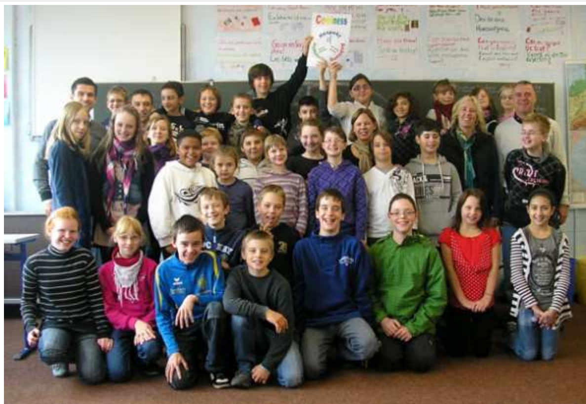
Die Schüler haben verstanden, dass Respekt und Hilfsbereitschaft wichtige Eigenschaften sind.

Treysa. Das Motto des diesjährigen Coolness Trainings „Vorschlag statt Vorwurf“, war für die Schüler der Klassen F5a und F5b der Schule im Ostergrund ein Ansporn.